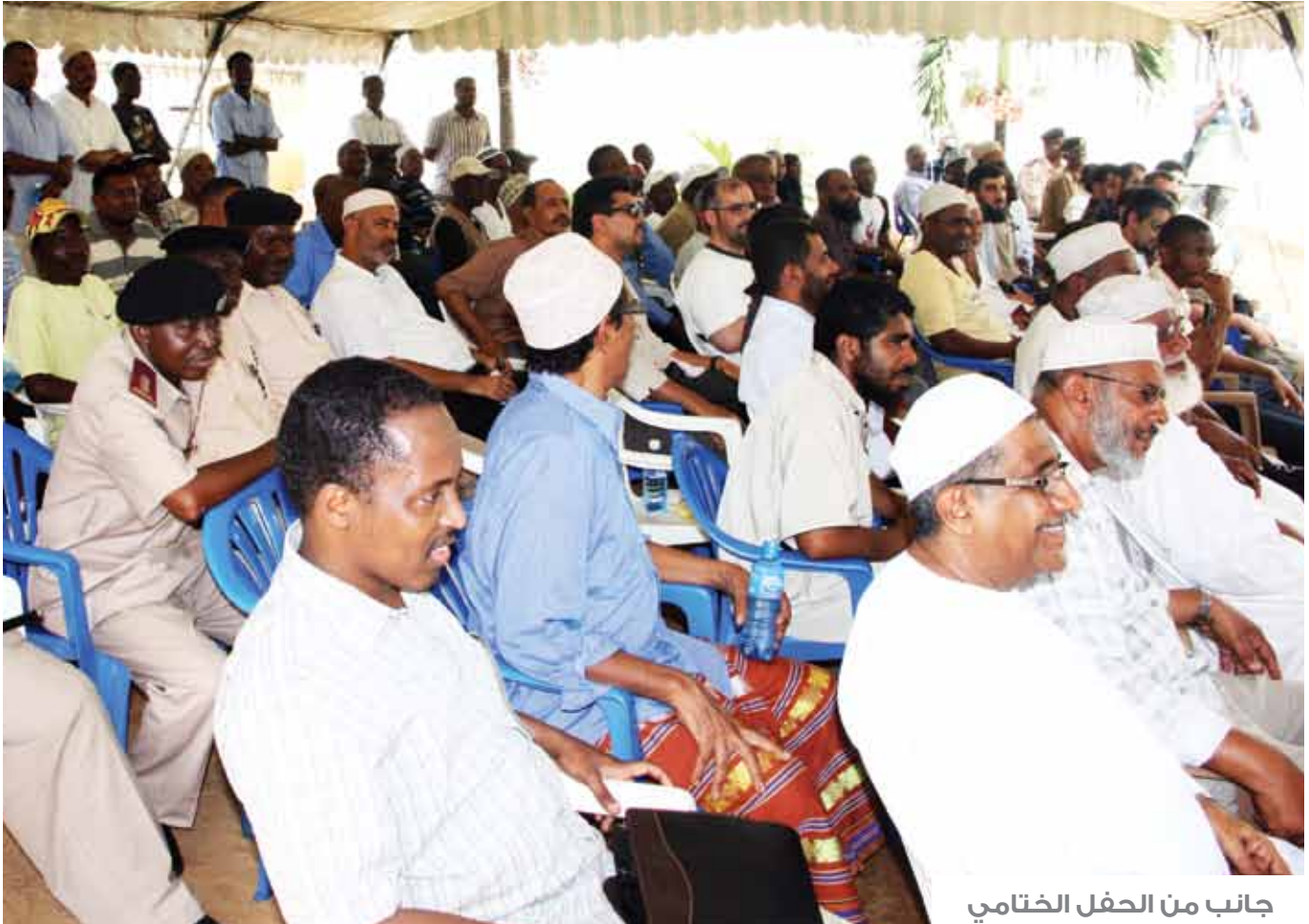
جانب من الحفل الختامي

في نهاية المخيم أقامت وزارة الصحة الجيبوتية حفل عشاء على شرف الفريق الطبي حضره وزير الصحة ومستشاروه وقدموا خلاله طلباً رسمياً إلى جمعية العون المباشر لفتح مكتب لها في جيبوتي، كما قدمت جمعية البيولوجيين الجيبوتية خطاب شكر لفريق الأمل الطبي وجمعية العون المباشر.