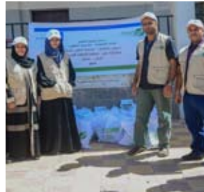
حملات توزيع التمور - من مشاريعنا