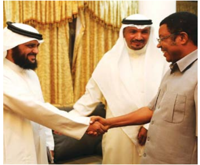
رئيس وزراء تنزانيا مستقبلاً د. عبد الله السميطة

غادر وفد من جمعية العون المباشر إلى جمهورية تنزانيا في زيارة عمل تضم عدة فعاليات وعلى رأسها افتتاح مشروع مركز د. عبد الرحمن السميطة رحمه الله والذي وضع اللبنة الأولى لهذا المشروع عام 2013 وكان آخر محطة له في أفريقيا قبل عودته مريضاً ثم وفاته رحمه الله .