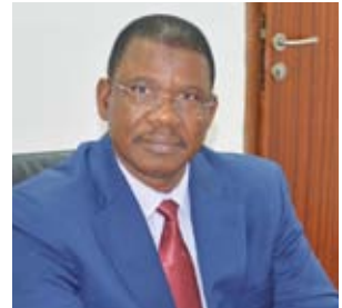
سفير بوركينا فاسو يزور جمعية العون المباشر