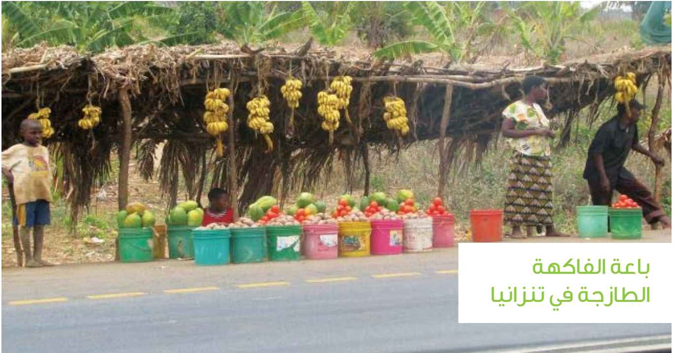
باعة الفاكهة الطازجة في تنزانيا