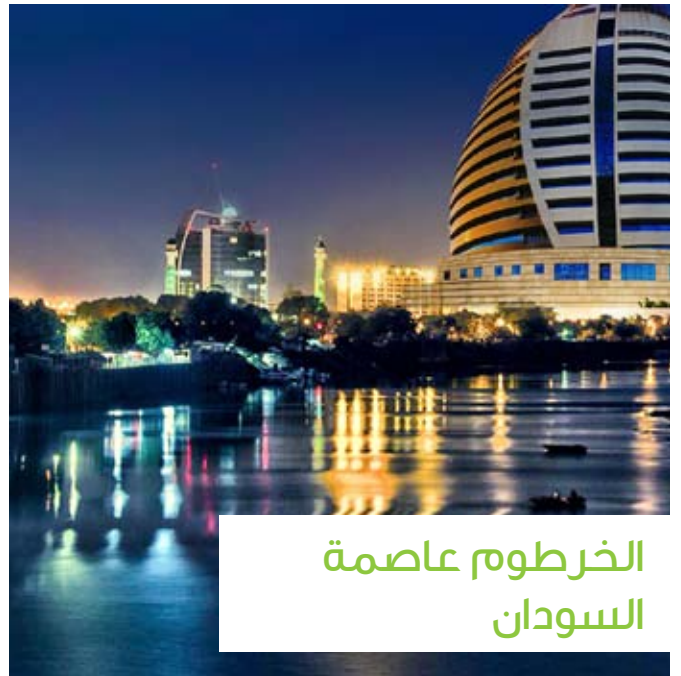
الخرطوم عاصمة السودان