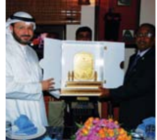
سفارة جيبوتي تكرم فريق الأمل الطبي