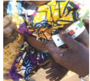
العون المباشر أغاثت 48000 إنسان وقدمت أدوية للمرضى في «ملاوي»