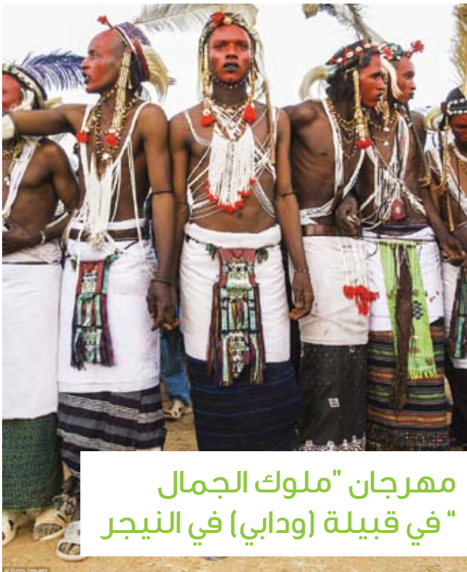
مهرجان "ملوك الجمال" في قبيلة (ودابي) في النيجر