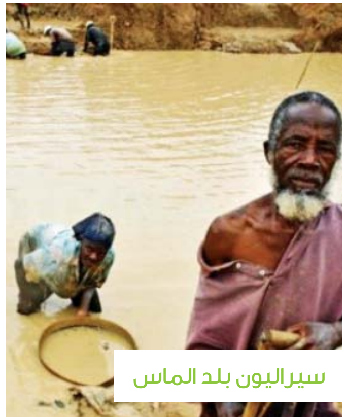
سيراليون بلد الماس