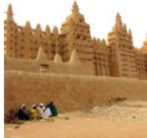
مسجد جنييه الكبير في مالي