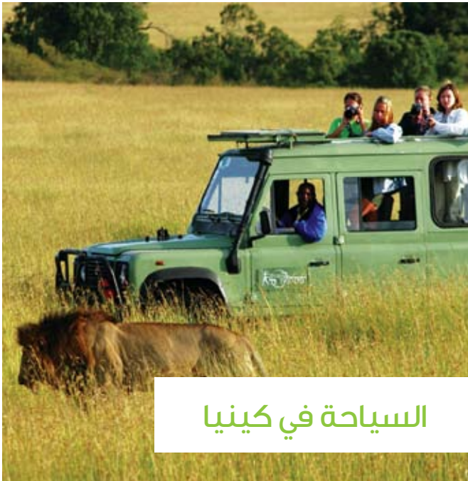
السياحة في كينيا