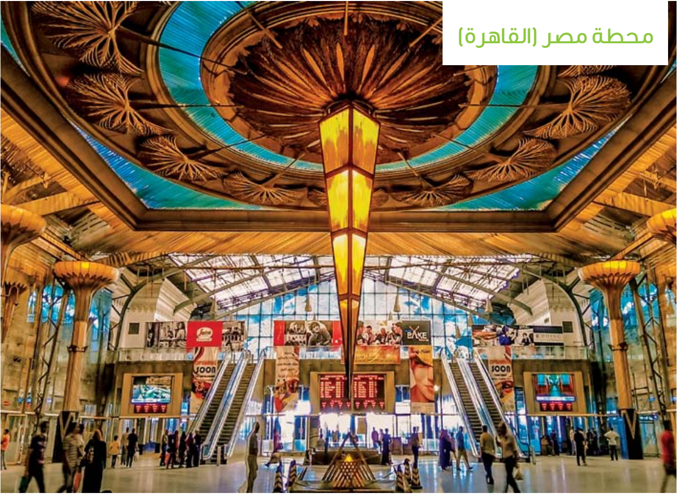
محطة مصر (القاهرة)