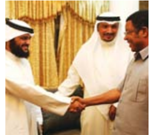
مدير العون المباشر يلتقي برئيس وزراء تنزانيا