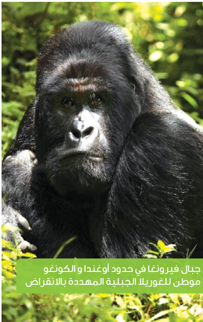
جبال فيرونغا في حدود أوغندا و الكونغو موطن للغوريلا الجبلية المهددة بالانقراض