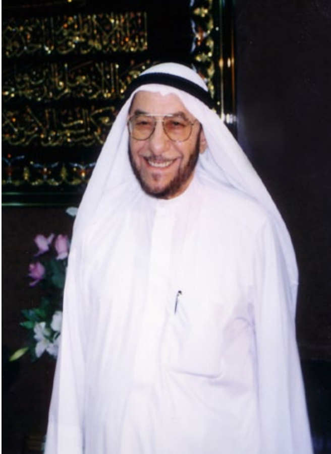
شجاعته وجراته وثقته بالله.