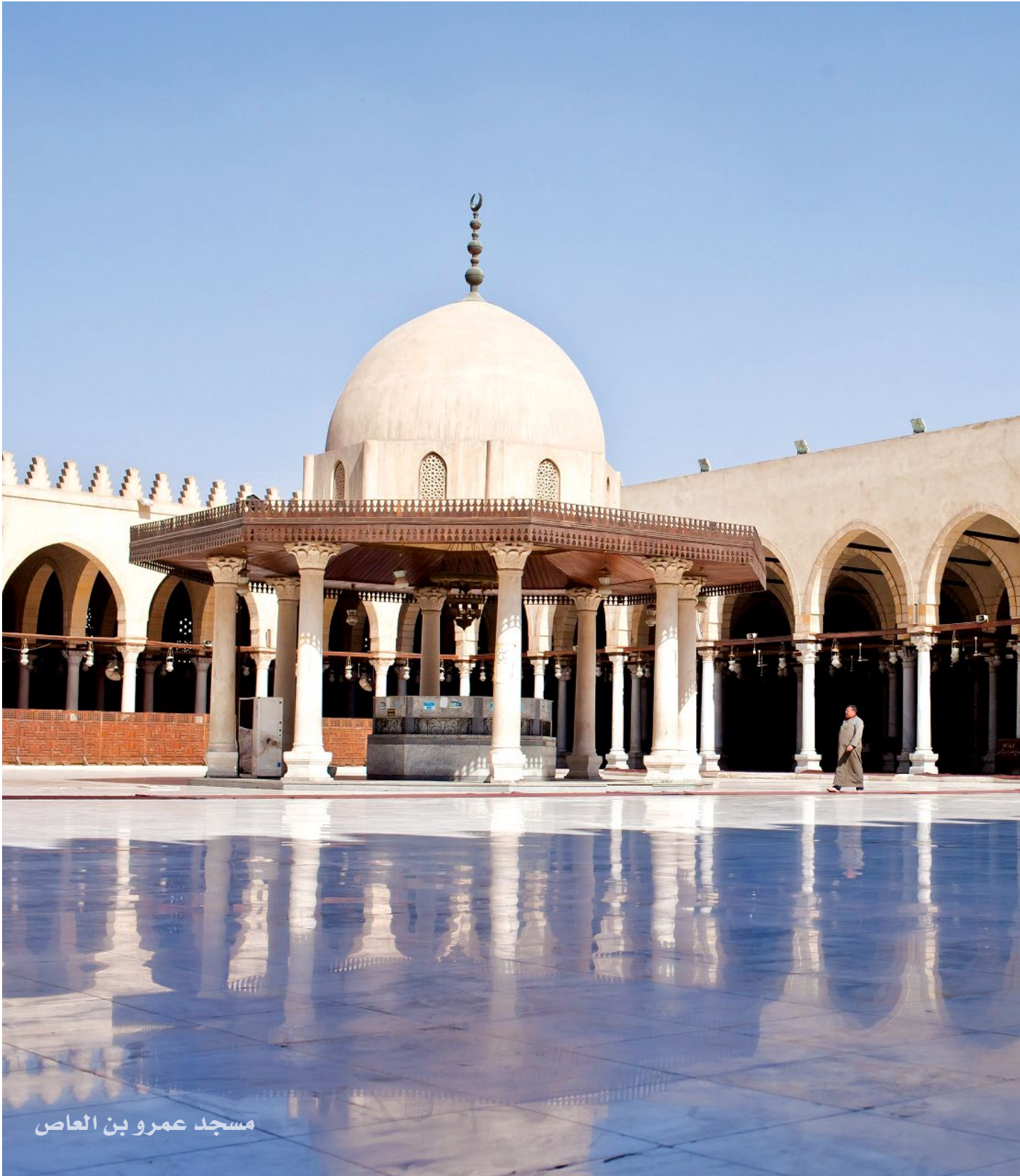
مسجد عمرو بن العاص