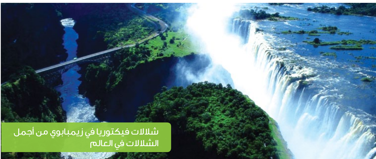
شلالات فيكتوريا في زيمبابوي من أجمل الشلالات في العالم