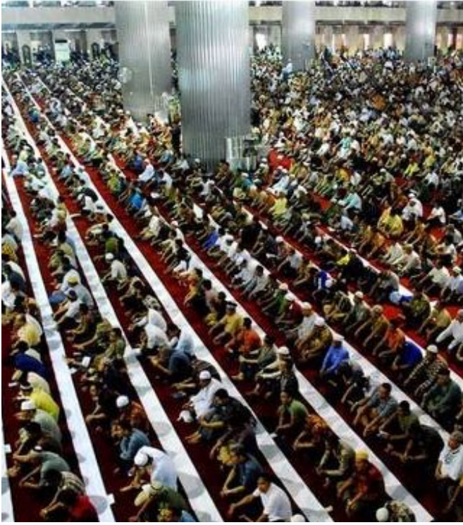
إحياء ليالي هذا الشهر الفضيل.

ومن التقاليد الجميلة المميزة في هذا البلد المسلم، أن المسلمين ينتهزون فرصة هذا الشهر المبارك ليتصالح المتخاصمون، ويتسامح المهاجرون، ويتناسوا ما وقع بينهم من خلاف وشقاق، وتقام حفلات التصالح هذه عادة في المساجد، وتسمى عندهم «حلال بحلال» ويشرف على ترتيب المجالس التصالحية وجهاء الناس وعلمائهم.