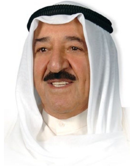
حضرة صاحب السمو أمير البلاد الشيخ صباح بن محمد آل صباح « حفظه الله ورعاه » "قائد الإنسانية"