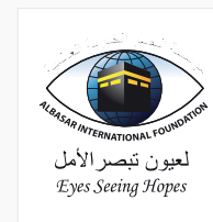
مؤسسة البصر العالمية