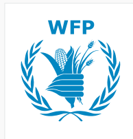
منظمة الغذاء العالمي