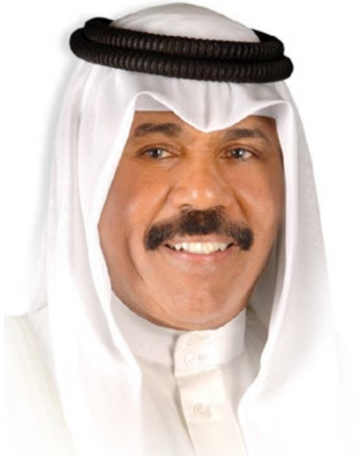
سمو ولي العهد الشيخ نواف بن عبد العزيز آل سعود « حفظه الله »