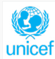
صندوق الأمم المتحدة الدولي لحالات الطوارئ للأطفال (اليونيسيف)