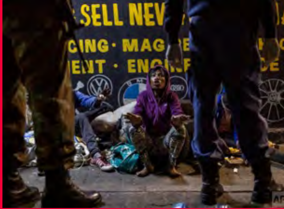
امراة بلا مأوى تتحدث إلى قوات دفاع جنوب إفريقيا وضباط الشرطة أثناء قيامهم بدوريات في الشارع في جوهانسبرغ