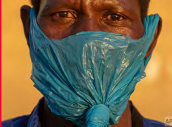
رجل يرتدي كيسًا بلاستيكيًا على وجهه كإجراء احترازي ضد انتشار فيروس كورونا شرق جوهانسبرغ .