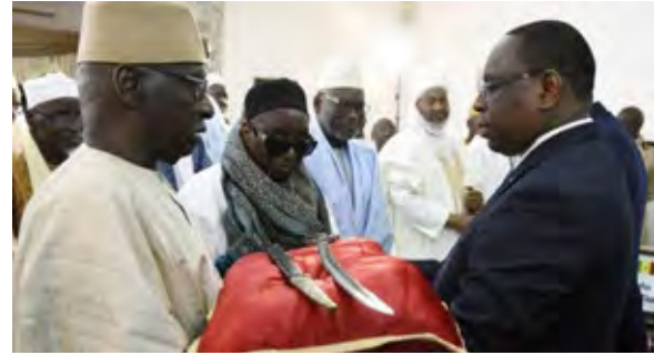
أحفاد الحاج عمر طعل يتوارثون خلافة الطريقة التيجانية حتى اليوم

وكانت دولة الحاج عمر من بين الأكبر في غرب إفريقيا