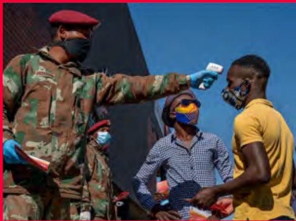
قوات الدفاع الوطني في جنوب إفريقيا تتحقق من درجة حرارة الناس

برؤية نوافذ السيارات المظلمة تنفتح وتصل أيديهم ببعض النقود أو علبة فاصوليا.