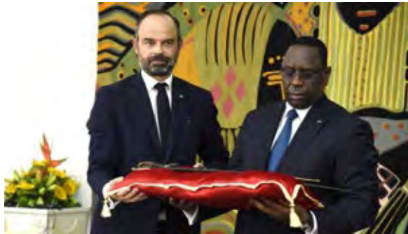
رئيس الوزراء الفرنسي، إدوارد فيليبي يسلم سيف الحاج عمر للرئيس السنغالي مكي سال

ويتوارث أحفاد الحاج عمر طعل خلافة الطريقة التيجانية حتى اليوم، وهي الأكثر انتشاراً في غرب إفريقيا. البي بي سي