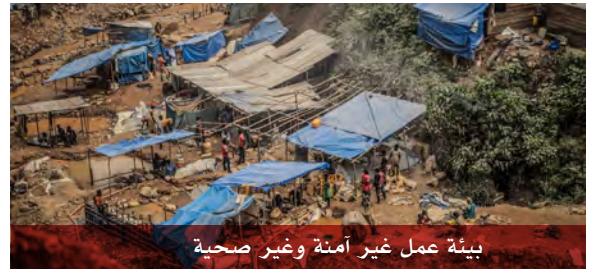
بيئة عمل غير آمنة وغير صحية