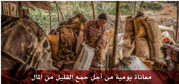
معاناة يومية من أجل جمع القليل من المال