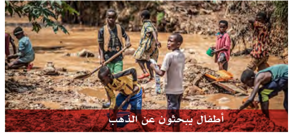
أطفال يبحثون عن الذهب