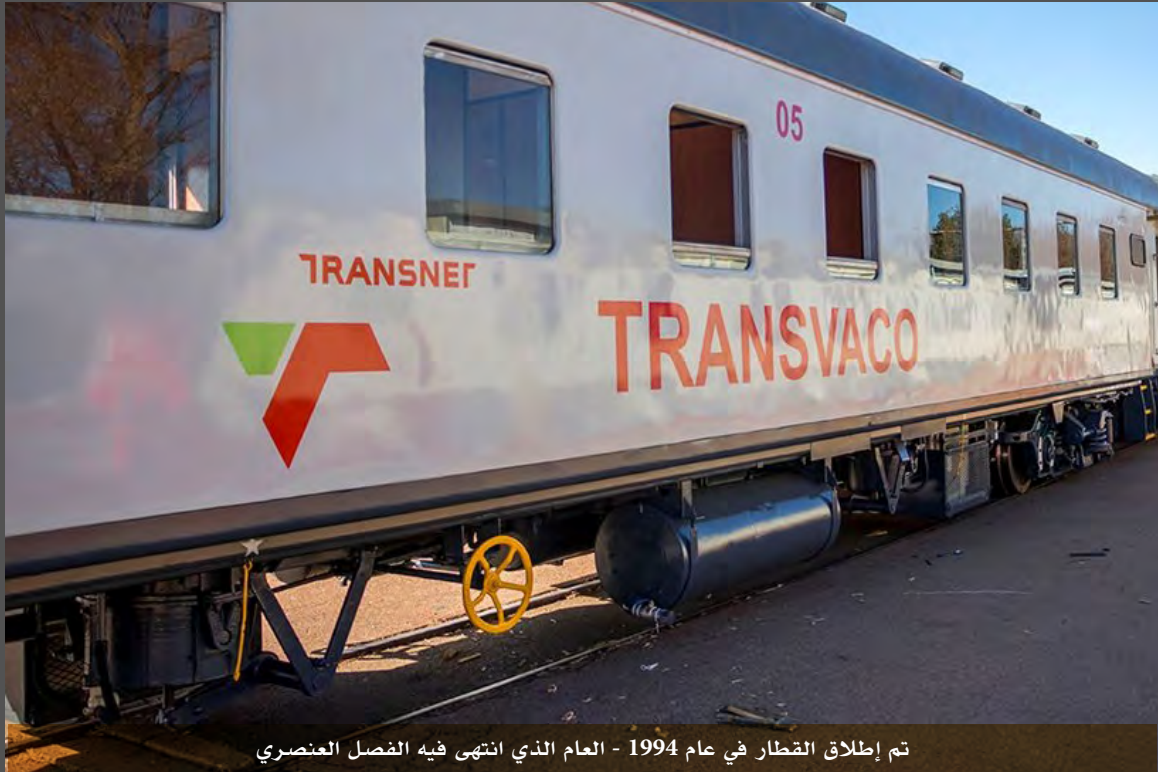
تم إطلاق القطار في عام 1994 - العام الذي انتهى فيه الفصل العنصري