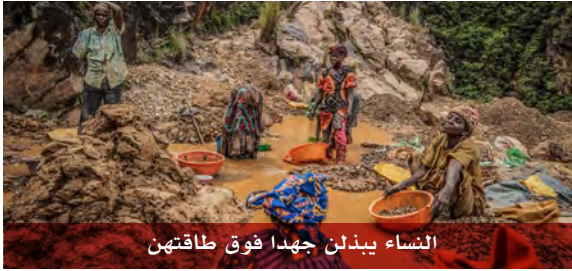
النساء يبذلن جهداً فوق طاقتهم

شهدت الجهود المبذولة لإدخال قدر أكبر من الشفافية في قطاع التعدين في جمهورية الكونغو الديمقراطية تقدماً ضئيلاً في التجارة التي تثري الأفراد والشركات بعيداً عن أنهار وتلال كاميتوغا الغامضة. مع قلة الإرادة السياسية لإحداث تغيير حقيقي ، يبدو أن وضع أولئك الذين يعيشون على بعض من أغنى تربة في العالم سيظل محفوظاً بالمخاطر.