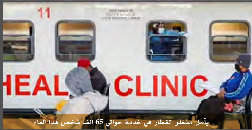
يأمل مشغلو القطار في خدمة حوالي 65 ألف شخص هذا العام

دفعت موسينا 30 راندًا فقط 2.10 دولار للاختبار والنظارات - وهو جزء بسيط مما كانت ستدفعه في مكان آخر. وعلى الرغم من كونها الاقتصاد الأكثر تقدمًا في القارة ، فإن جنوب إفريقيا تعاني انتشار الفقر والبطالة المرتفعة. ولذا فإن الرعاية الصحية عملياً بعيدة المنال بالنسبة للكثيرين . و يدير هذه