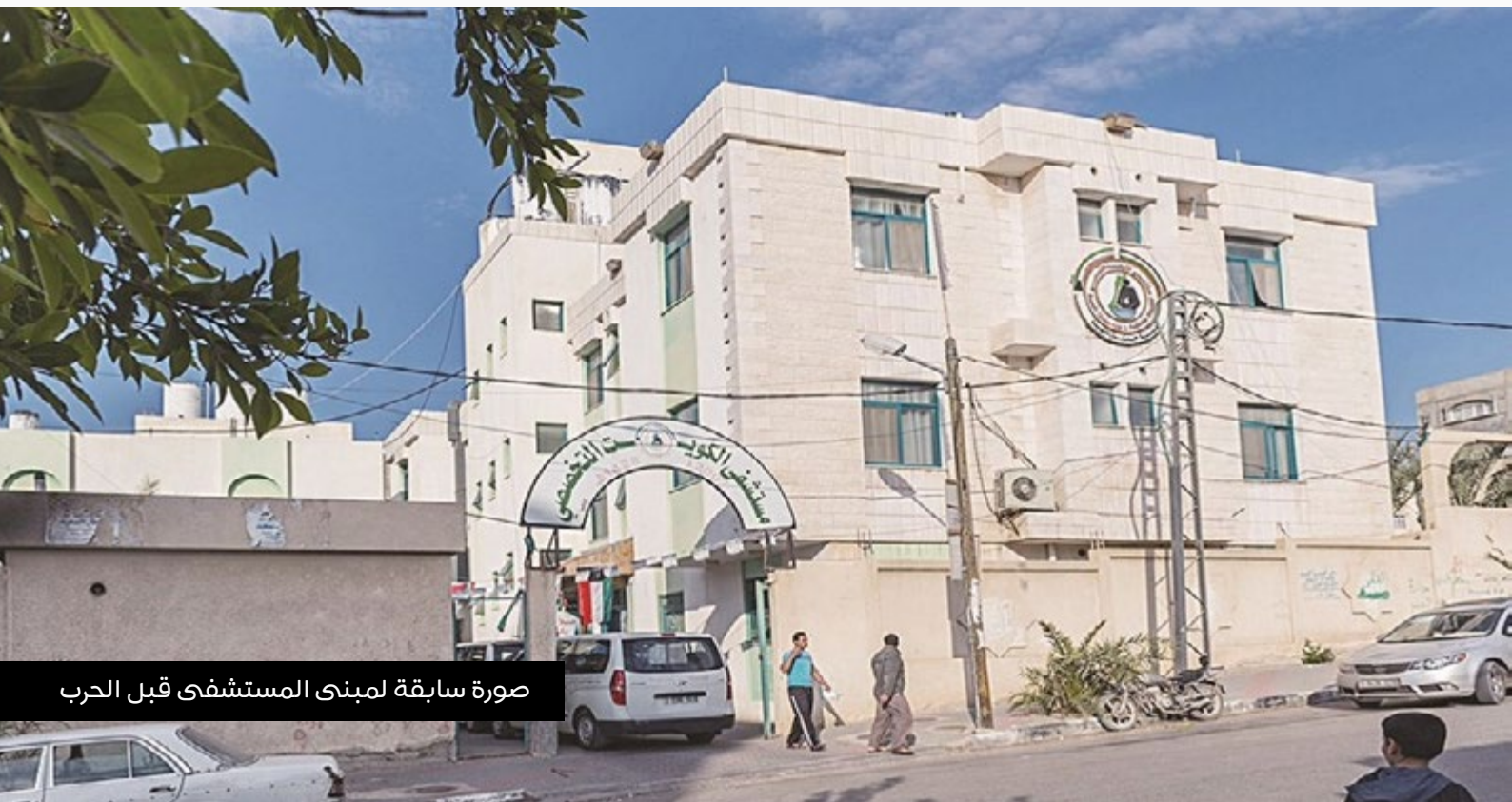
صورة سابقة لمبنى المستشفى قبل الحرب

أنشئ مستشفى الكويت التخصصي في محافظة رفح كمستشفى خيري لا يهدف إلى الربح بل لتقديم خدمات طبية مميزة لعموم السكان وبالذات الفئات الضعيفة والفقيرة وبأسعار مخفضة وعلى مدار الساعة، وهذا بدوره يلقي بأعباء مالية ضخمة وزيادة في النفقات التشغيلية مما يمثل تحدٍ لقدرة المستشفى على الاستمرار في تقديم خدماته، إضافة التدمير كلي للمنظومة الصحية في قطاع غزة ما دعى المستشفى لإنشاء مستشفى ميداني ضخم بمحافظة خان يونس يقدم الخدمات الطبية للنازحين من محافظات وسط وجنوب قطاع غزة، وعليه فإن المستشفى بحاجة إلى مواصلة الدعم الخارجي وتبني المشاريع التطويرية والخيرية لدعم الفئات المهمشة.