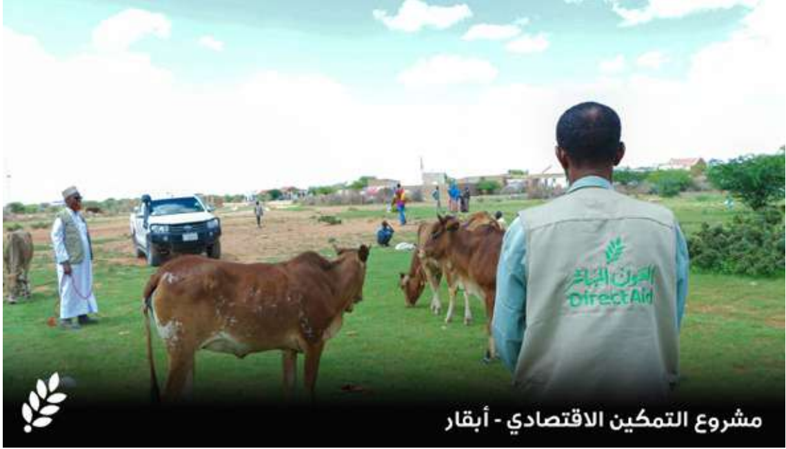
مشروع التمكين الاقتصادي - أبقار

تعد عملية توزيع الماعز والأبقار على الأسر الفقيرة من المشاريع التنموية المستدامة التي تهدف إلى تحسين الظروف المعيشية للفئات المحتاجة، حيث يساهم هذا النوع من المشاريع في تعزيز الاكتفاء الذاتي للأسر من خلال توفير مصادر دائمة للحليب واللحوم، بالإضافة إلى بيع الفائض لتحقيق دخل مادي، كما يوفر هذا النوع من المشاريع شعورًا بالتمكين للأسر الفقيرة، حيث تتحول من الاعتماد الكامل على المساعدات إلى الاعتماد على الذات وتحقيق الاستقرار المالي. كما يعزز التماسك الاجتماعي من خلال تحسين الظروف المعيشية لأفراد المجتمع ككل.